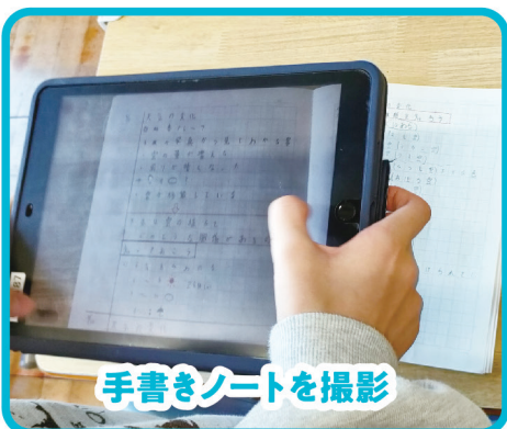
手書きノートを撮影