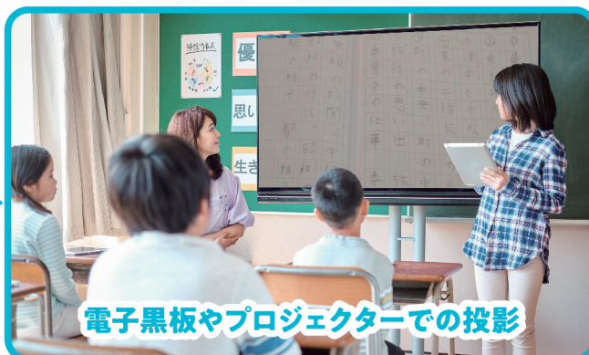
電子黒板やプロジェクターでの投影